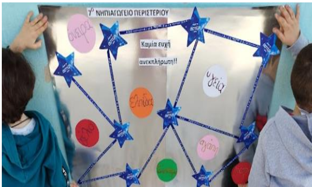
7 ο ΝΗΠΙΑΓΩΓΕΙΟ ΠΕΡΙΣΤΕΡΙΟΥ