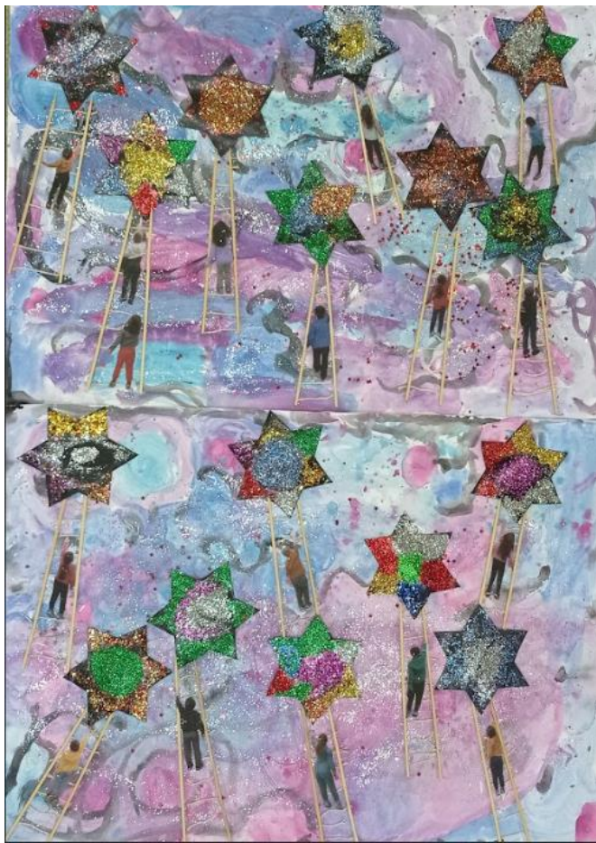
9ο ΝΗΠΙΑΓΩΓΕΙΟ ΧΙΟΥ