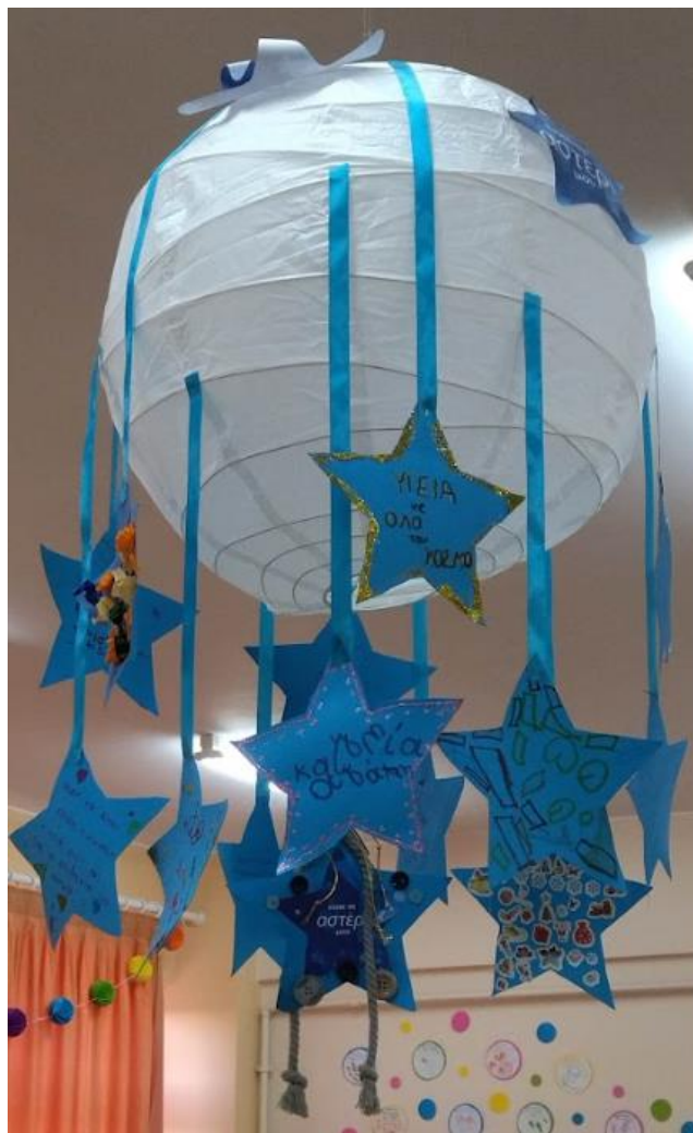
9 ο ΝΗΠΙΑΓΩΓΕΙΟ ΤΡΙΠΟΛΗΣ