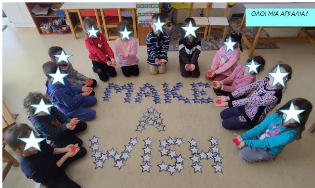
2 ο ΝΗΠΙΑΓΩΓΕΙΟ ΝΕΑΠΟΛΗΣ ΛΑΚΩΝΙΑΣ