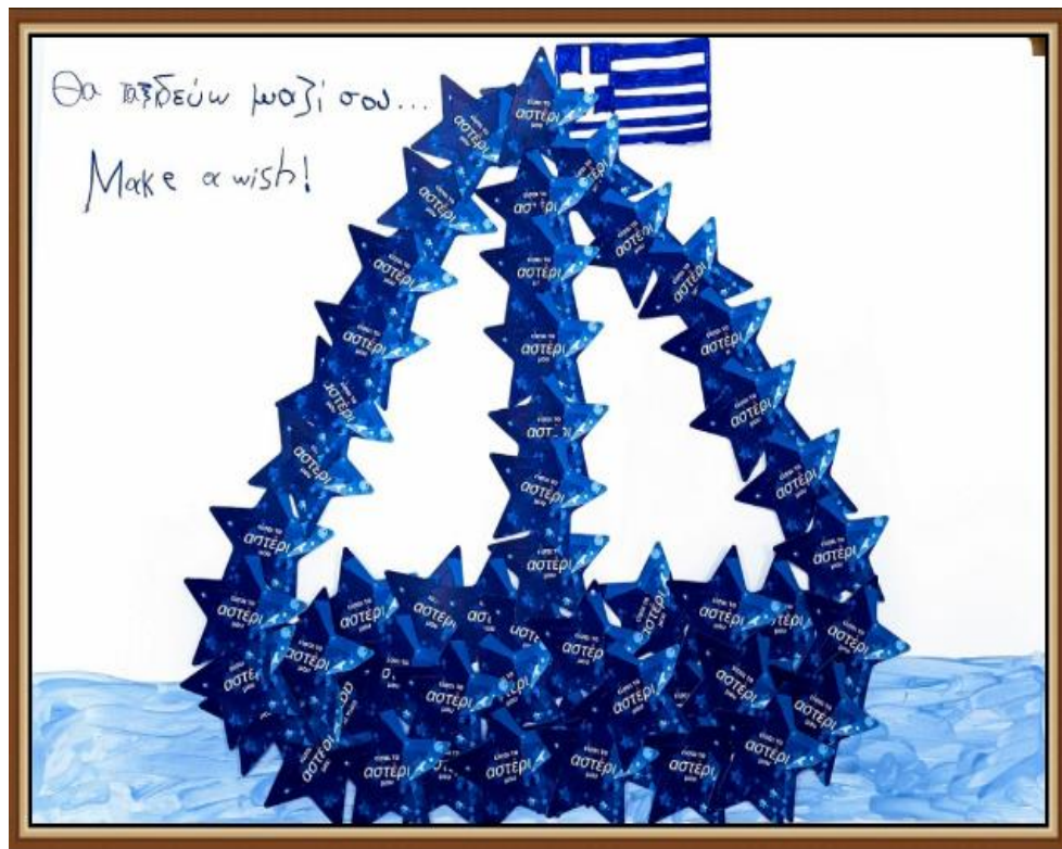
4 ο ΝΗΠΙΑΓΩΓΕΙΟ ΓΑΣΤΟΥΝΗΣ