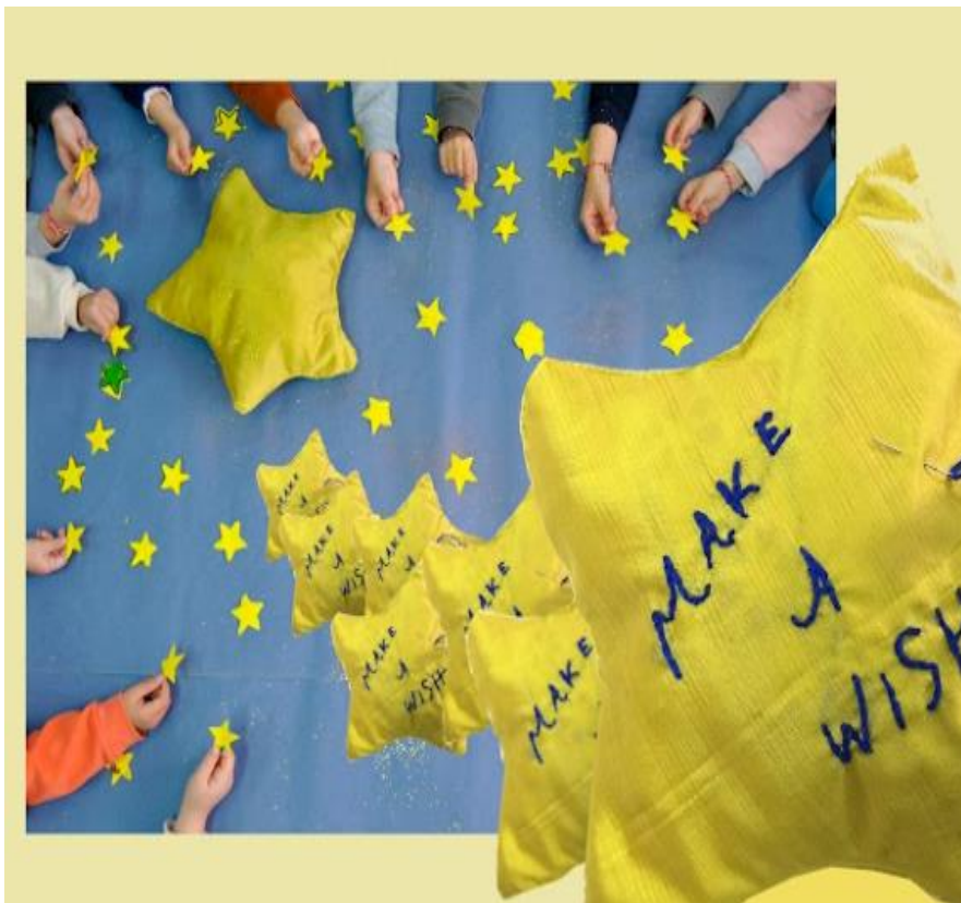
2ο ΝΗΠΙΑΓΩΓΕΙΟ ΤΗΝΟΥ