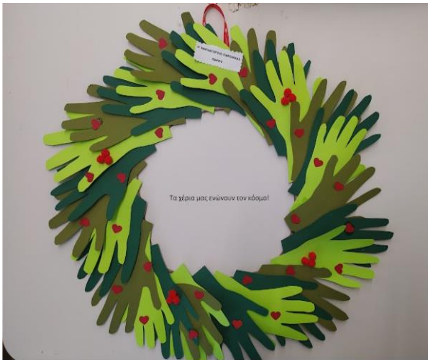
4ο ΝΗΠΙΑΓΩΓΕΙΟ ΠΑΡΟΙΚΙΑΣ ΠΑΡΟΥ