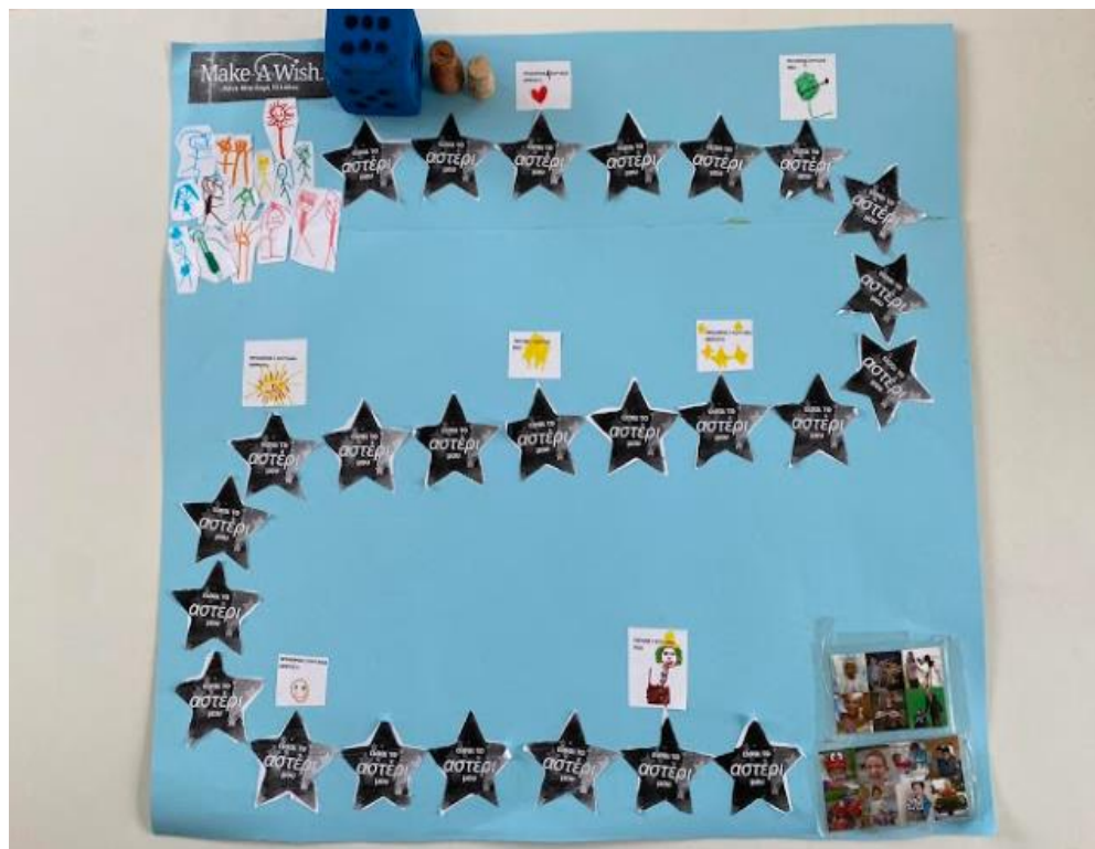
12ο ΝΗΠΙΑΓΩΓΕΙΟ ΒΥΡΩΝΑ